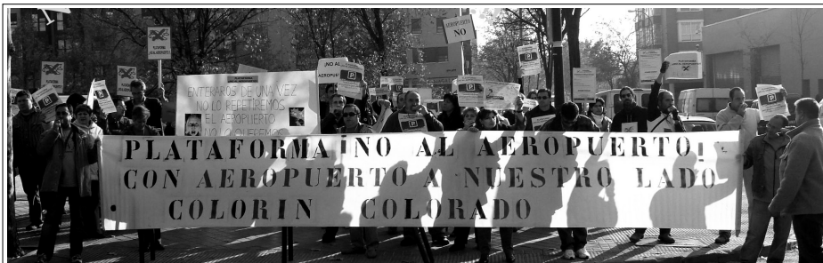
Concentración contra el aeropuerto frente al parlamento madrileño.

La segunda de las mentiras se desmonta poniendo el ejemplo de la Radial 5. ¿Conocen ustedes a alguien que trabajara en la construcción de la Radial 5? Las grandes empresas de construcción poseen cuadrillas de trabajadores que desplazan de unas obras a otras según su necesidad y nunca cuentan con trabajadores locales. Una vez construido el aeropuerto se trasladarán los trabajadores de Cuatro Vientos. El Alcalde de El Álamo argumenta que se generará un polígono industrial que dará trabajo a los y las vecinas de los municipios cercanos. Ese polígono ya estaba proyectado en el Plan General de Ordenación Urbana que tiene paralizado el Partido Popular para su modificación. En esta modificación incluirán el aeropuerto y reducirán a cero el crecimiento de El Álamo, tanto las actividades urbanísticas e industriales, que son el motor de crecimiento de un pueblo. Con un aeropuerto en nuestro entorno AENA(Aeropuertos Españoles y Navegación Aérea) no autorizaría los desarrollos urbanísticos en nuestros municipios.